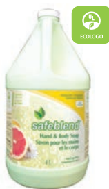
Pamplemousse Rose CODE: HLPG