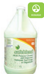
Sans Parfum CODE: CCXX