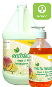
Mangue Papaye CODE: HLMP