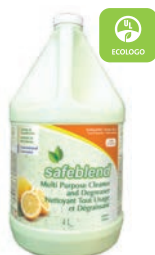
Citron CODE: CCLE