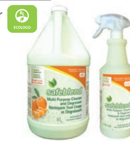
Huile de Tangerine CODE: CRTO