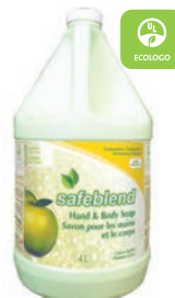
Pomme Verte CODE: HLG R