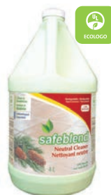
Huile de Pin CODE: NCPO