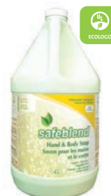
Sans Parfum CODE: HLXX