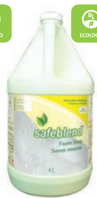
Sans Parfum CODE: HFXX