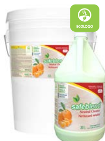
Huile de Tangerine CODE: NCTO