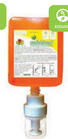
Savon Mousse Cartouche CODE: HFMP LR4