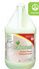
Sans Parfum CODE: NCXX