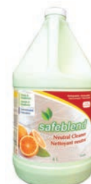
Orange CODE: NCOR