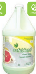
Pamplemousse Rose CODE: HFPG