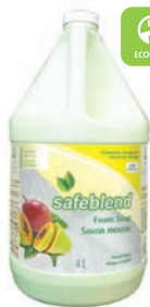
Mangue Papaye CODE: HFMP