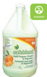
Huile de Tangerine CODE: CCTO